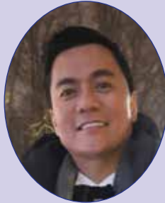
JUN ROBLES LANA

À l'âge de 19 ans, Jun reçoit la mention honorable au Palanca Literary Award – équivalent du Prix Pulitzer aux Philippines – dans la catégorie théâtre. Il est à nouveau primé au Palanca pour l'écriture de pièces, scénarios et scripts, lors des dix années suivantes! En 1998, il reçoit le prix du meilleur scénario au Festival du film indépendant de Bruxelles. Dès lors, il rédige nombre de scénarios et réalise en 2012 son premier long-métrage présenté pour la sélection pré-Oscars. Ses films suivants font le tour des festivals internationaux.