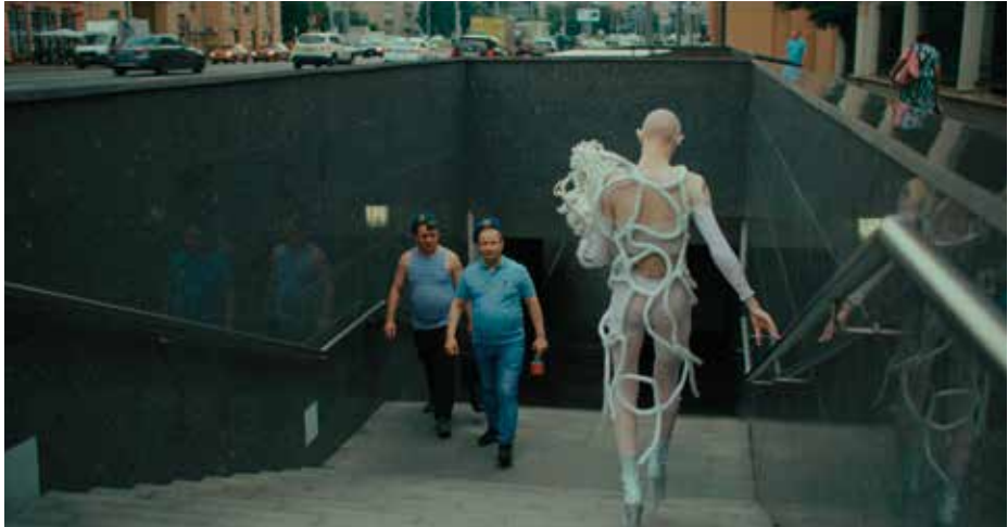
PREMIÈRE SUISSE ROMANDE

98 MIN - DOC. (2023) VO: RUSSE - ST: ANG DÈS 16 ANS