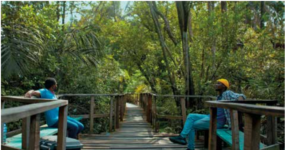
PREMIÈRE SUISSE ROMANDE

92 MIN – FICTION (2023) VO: ANG, IBO, YORUBA – ST: FR TOUT PUBLIC