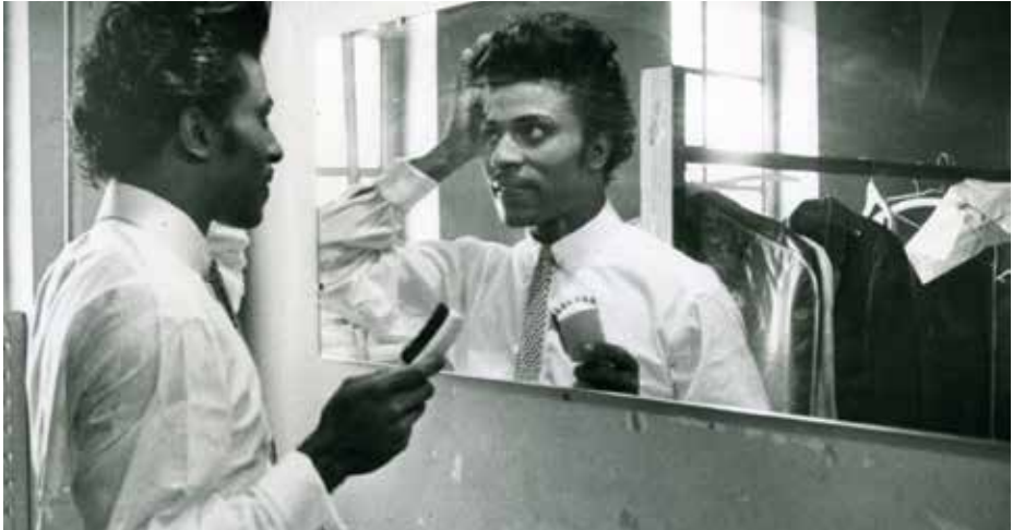
FILM DE CLÔTURE / PREMIÈRE SUISSE ROMANDE