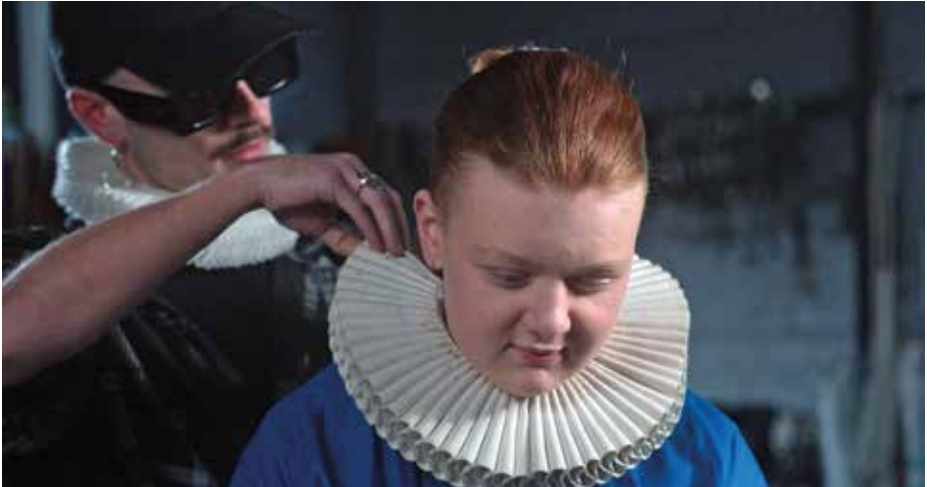
FILM D'OUVERTURE / AVANT-PREMIÈRE GENEVOISE

98 MIN – DOC. (2023) VO : FR TOUT PUBLIC